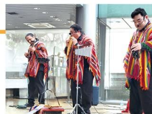
ゲスト講師：フォルクローレ演奏グループ ウィニヤイ (WIÑAY)