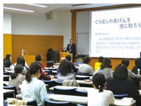
2019年冬の勉強会 ワークショップの様子