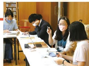
2023年グループ研修の様子